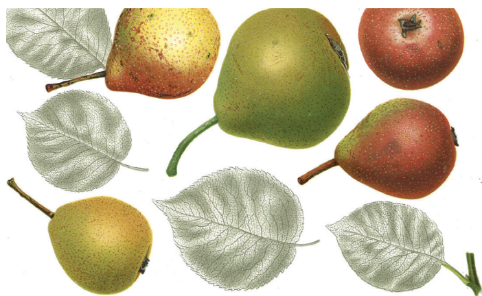
Moštnice: Sortiment hrušk moštnic je bil včasih zelo pester. Pri nas najbolj razširjena med njimi je dala ime sadjarskemu muzeju.