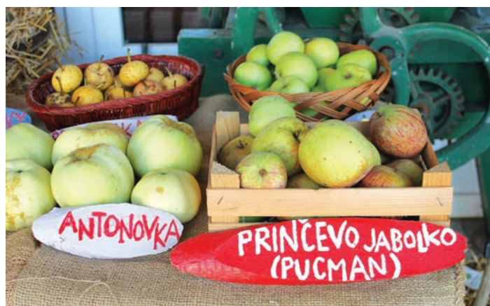
Razstava sadja: Ob otvoritvi je bilo na ogled tudi nekaj zgodnjih sort jablan in hrušk.