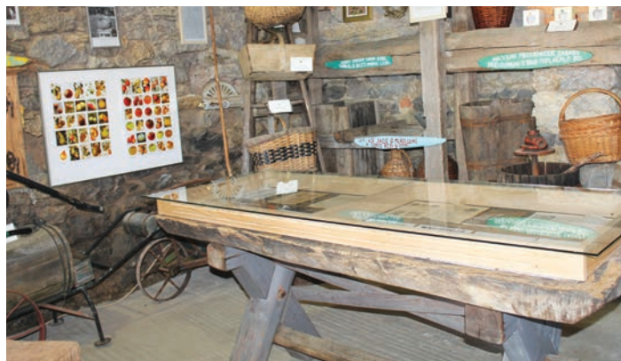
Muzej Tepka: Del notranjosti sadjarskega muzeja Tepka.