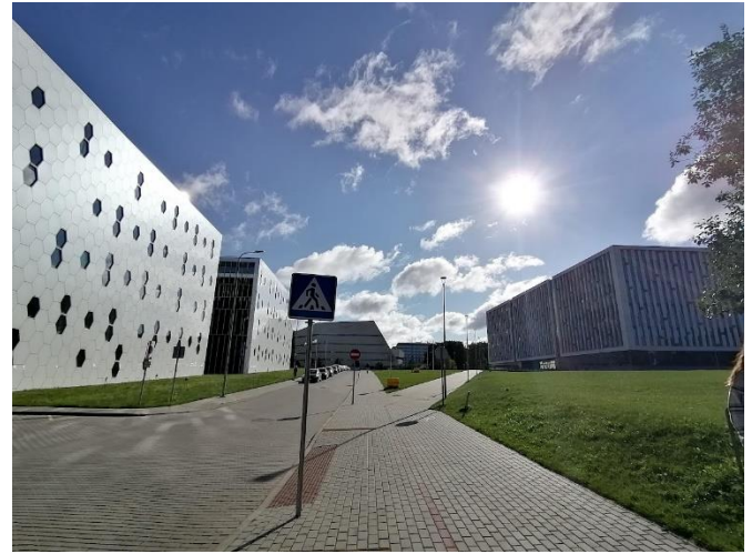
Life Sciences Center in kampus na zgornjih dveh slikah