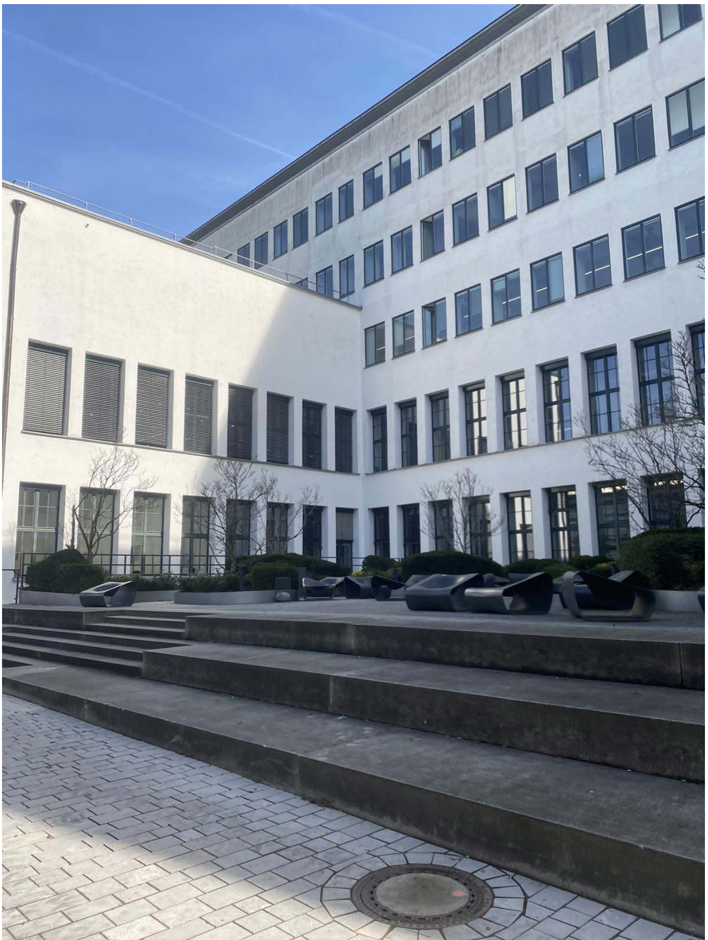
Kampus v Minhenu (TUM)