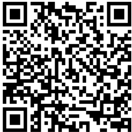
Table / Jamboard